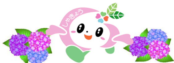
マスコットキャラクター「はーとちゃん」