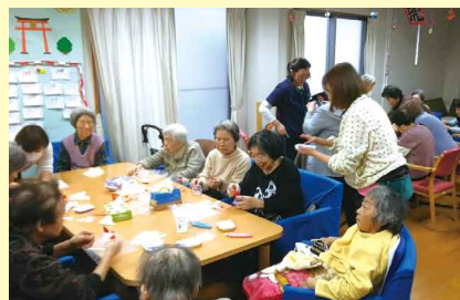
かめやん家のつどい