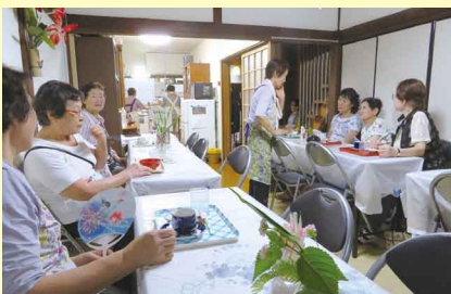
勝山みんなが集うば おひいさん