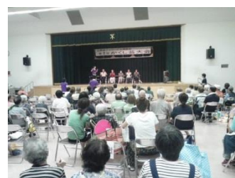
デイサービス連絡会 かくし芸大会