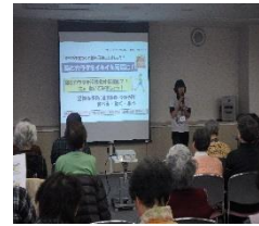
おかちやま脳トレ教室