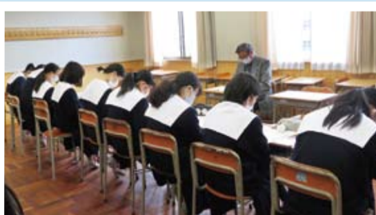
ボランティアグループによる音訳体験のようす