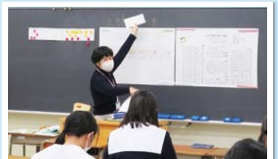
ボランティアグループによる点訳体験のようす