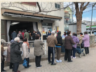
<鶴橋地域社協広報編集委員>