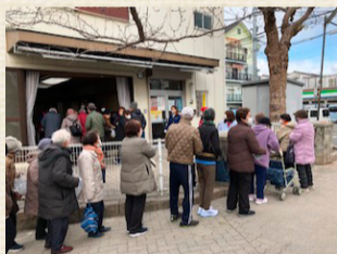
<鶴橋地域社協広報編集委員>