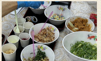
<東桃谷地域社協広報編集委員>