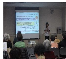
おかちやま脳トレ教室