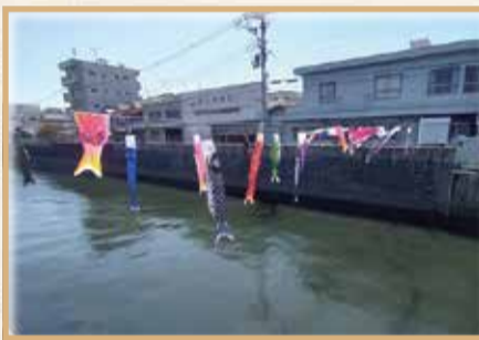
<中川地域社協広報編集委員>